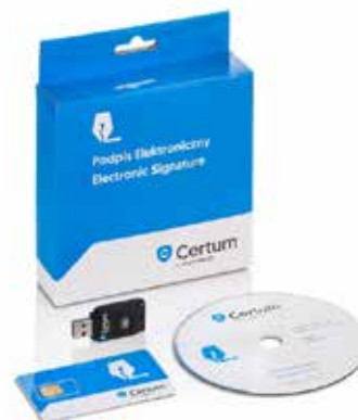
Zestaw cryptoCertum MINI z czytnikiem USB