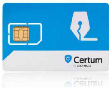
Zestaw cryptoCertum MINI bez czytnika

Karta Certum jest wymieniona na stronie www.cepik.gov.pl jako spełniająca wymagania techniczne.